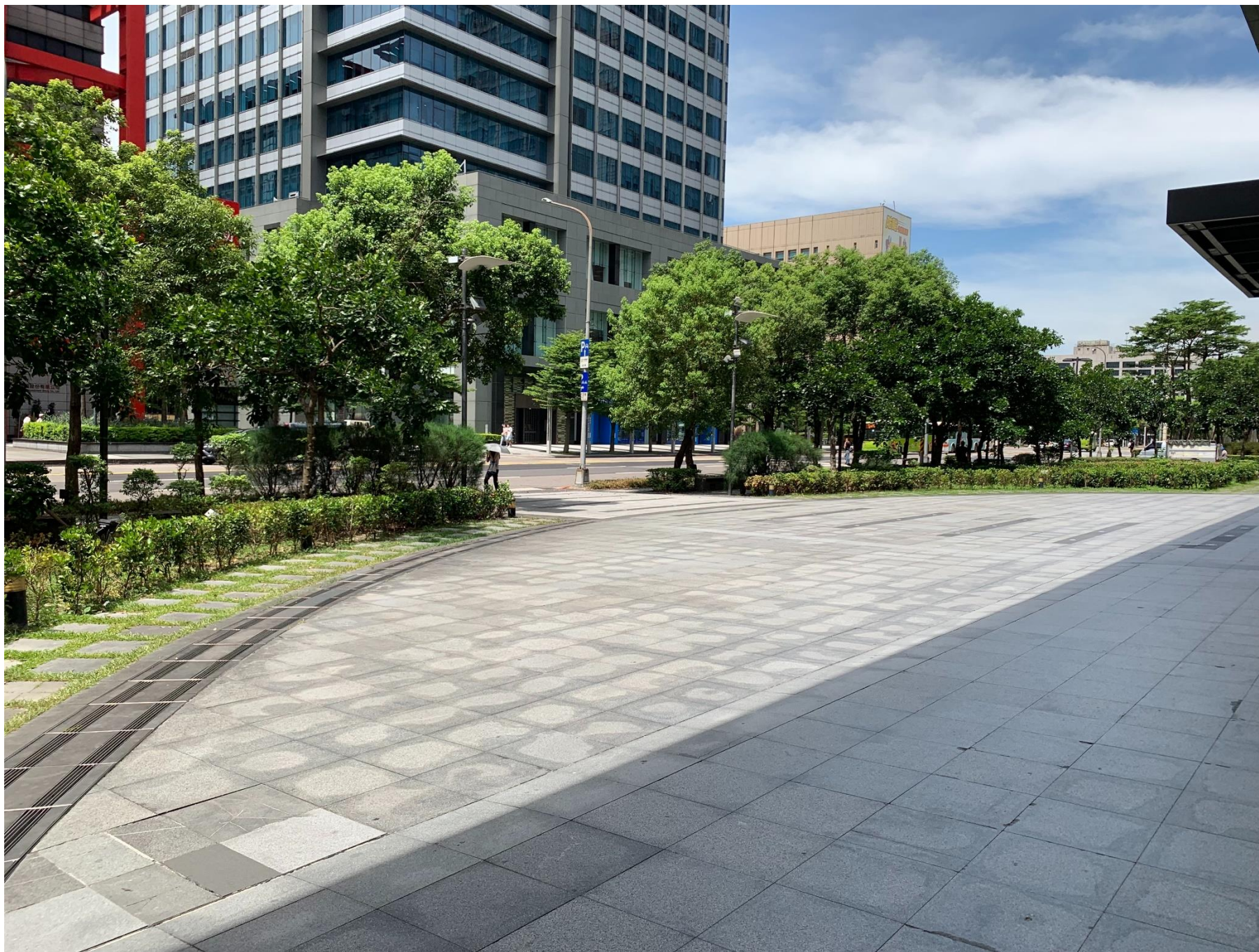
信義 351 號公園—松高路新光三越 A4 南側 (280 平方公尺 (含中間正方形區域))