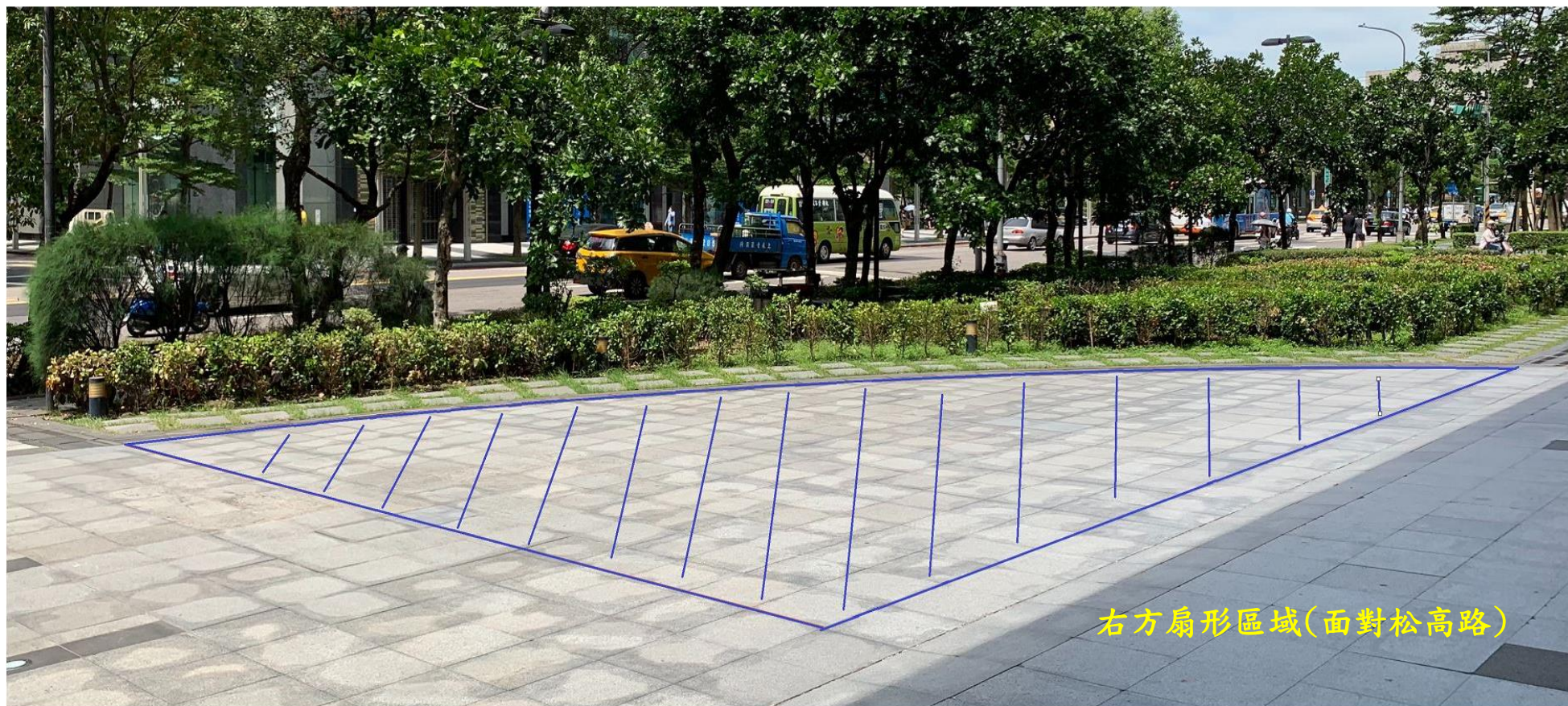
右方扇形區域(面對松高路)