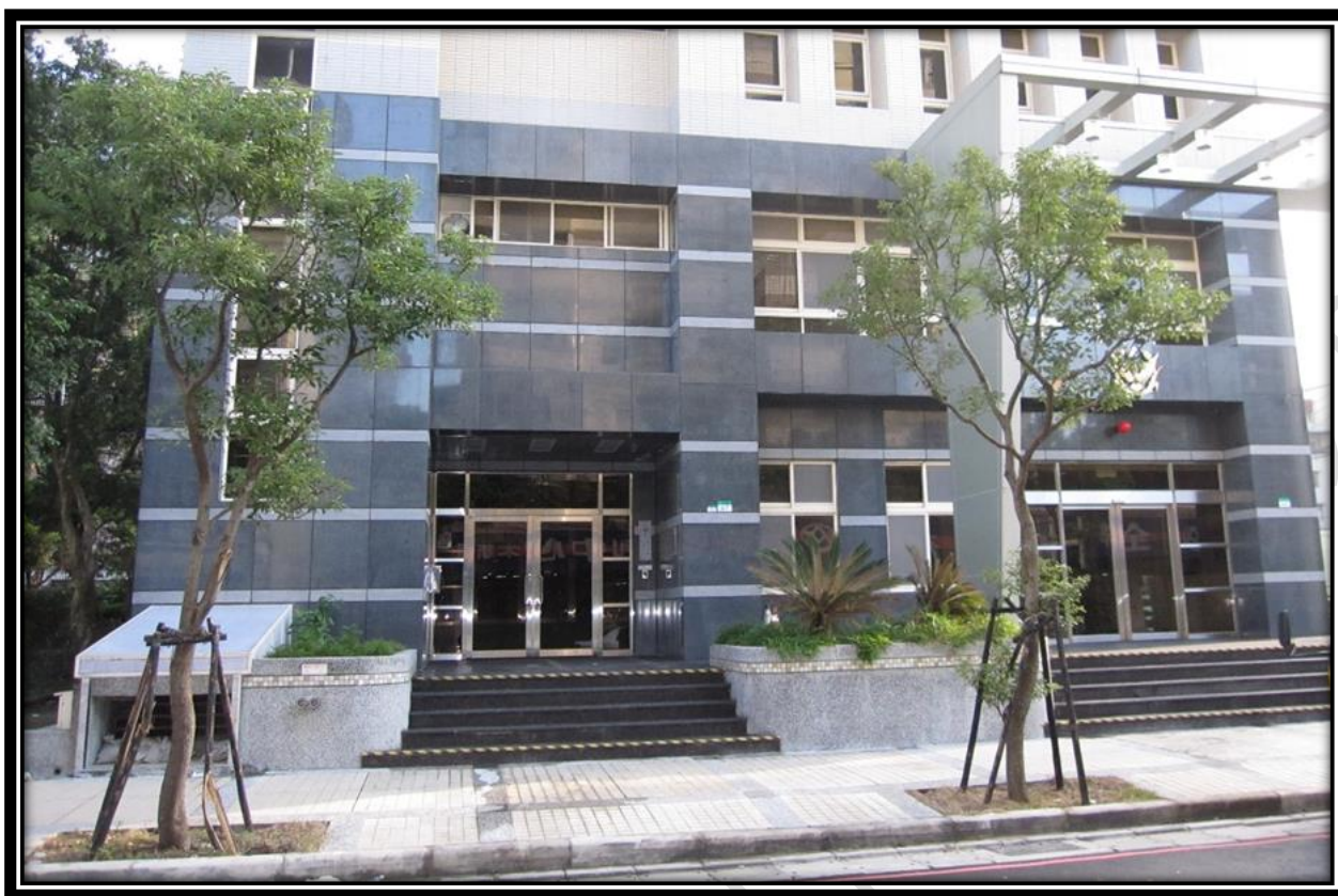
活動中心大門入口