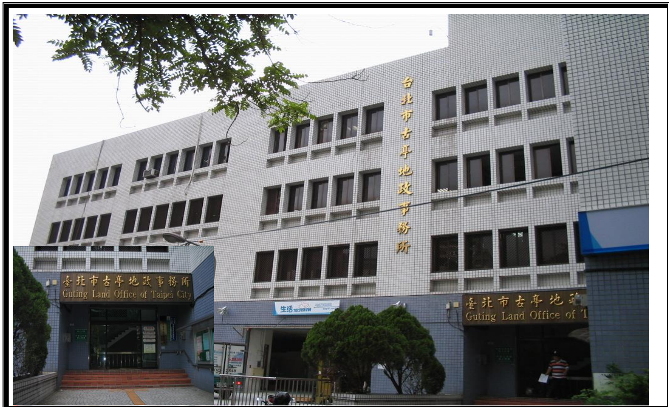
活動中心大門入口