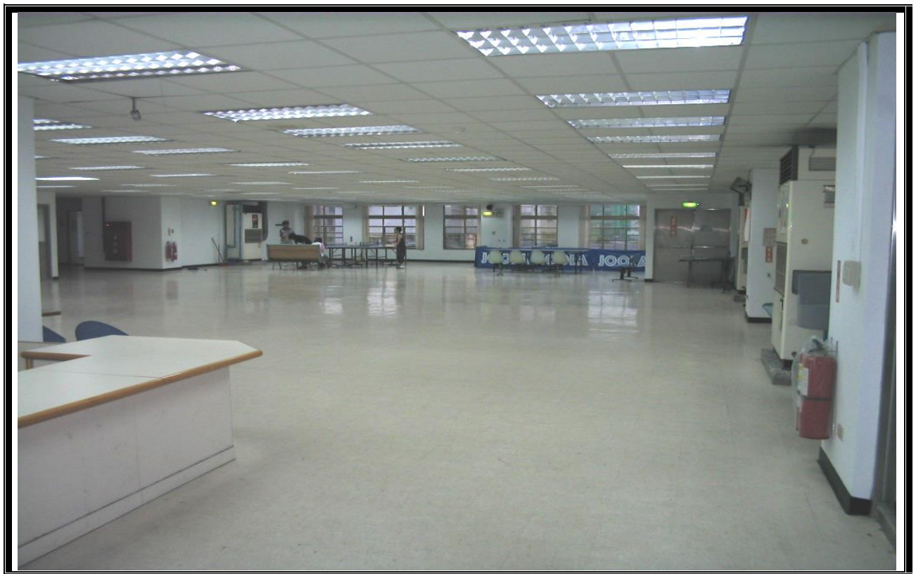
活動中心內部空間