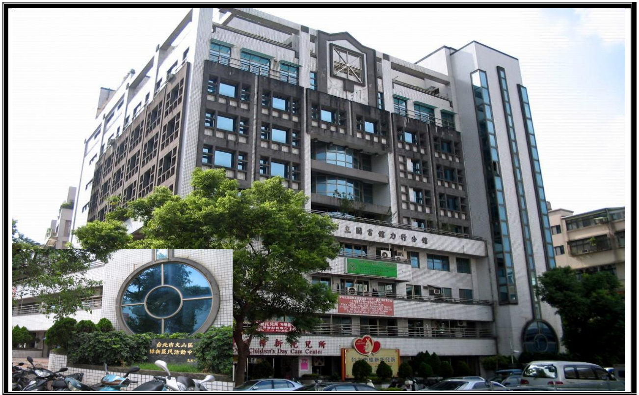
活動中心大門入口