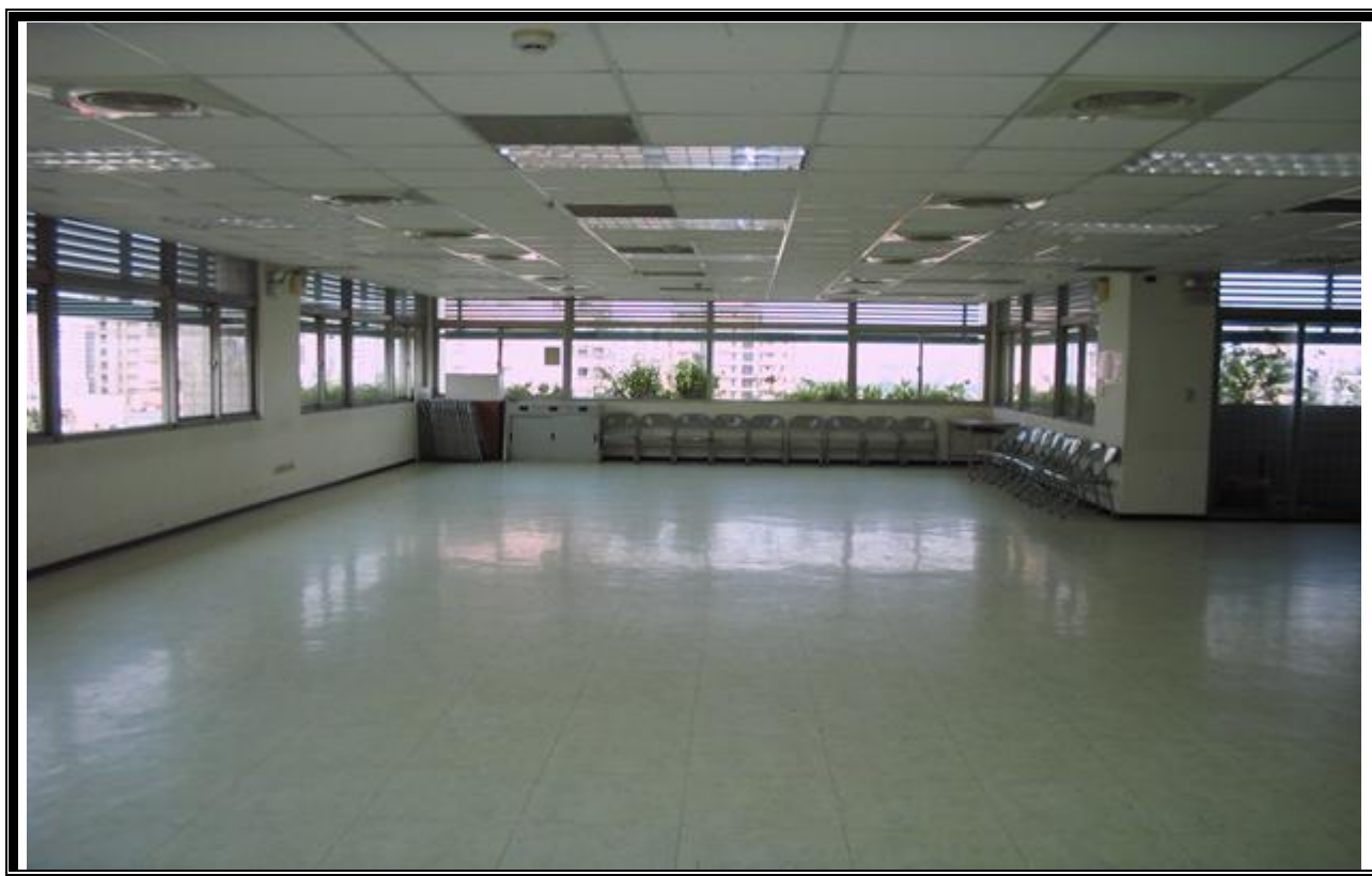
活動中心內部空間