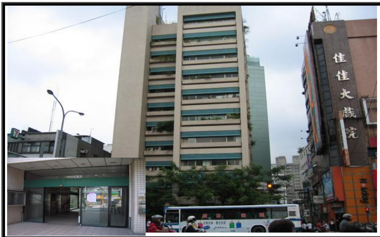
活動中心大門入口