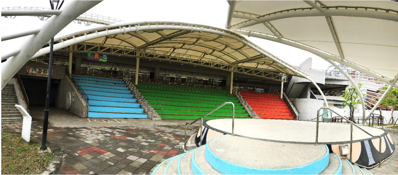
圓形舞台、舞台尺寸:直徑9m 高0.7m、開放式遮雨篷階梯座位約計450席

(個人、政府機關、各級學校或經政府登記立案之企業、公司行號、公私立團體及臺北市街頭藝人皆可申請)