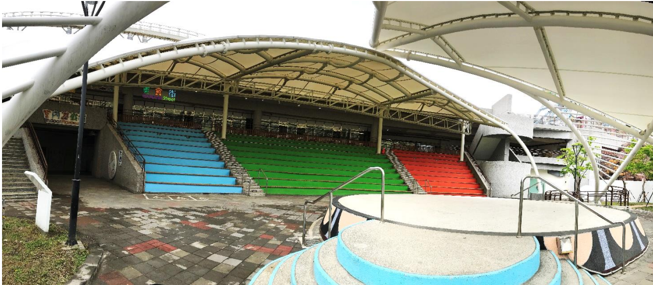
圓形舞台、舞台尺寸:直徑9m 高0.7m、開放式遮雨篷階梯座位約計450席

(個人、政府機關、各級學校或經政府登記立案之企業、公司行號、公私立團體及臺北市街頭藝人皆可申請)